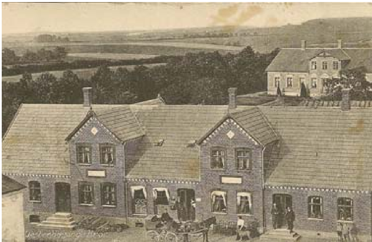
Den nye kro opført i starten af 1900-tallet var en flot symmetrisk bygning opført i røde sten.

Christen Skytte var en driftig mand, han solgte jorden på Søbovej og købte gården matr. 12a, fra den tid kaldet Skyttegården.