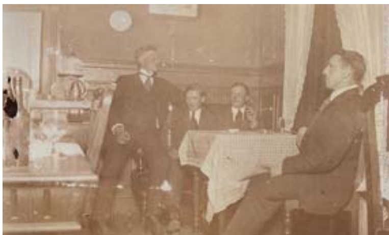
Interiør fra krostuen omkring 1915.