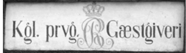
Vester Hæsinge Kro var prydet af dette indmurede "skilt" med en flot muret frise rundt om.

Det var ikke altid lige interessant at få uventede gæster, så de rejsende kunne derfor ikke være sikre på at finde logi. Ved kongelige forordninger blev det efterhånden påbudt at oprette offentlige værtshuse og kroer, som fik ret til blandt andet salg af øl og brændevin til de rejsende, men ikke til egnens befolkning. Med beværterloven af 1912 forsvandt disse privilegier.